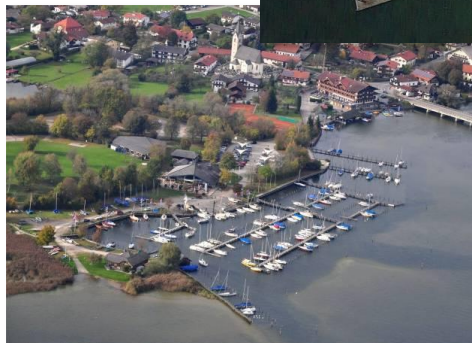
Seebruck am Chiemsee