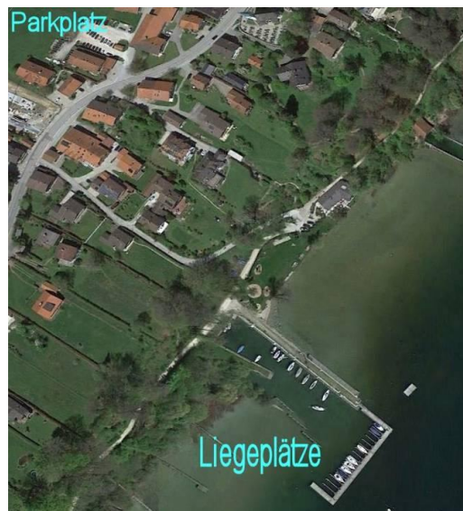
Gollenshausen am Chiemsee