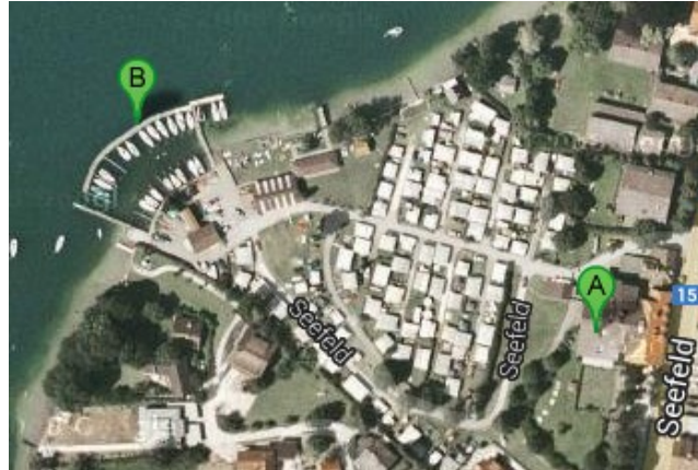
Anfahrtsskizze nach Gollenshausen am Chiemsee (A: Parkplatz / B: Steg)