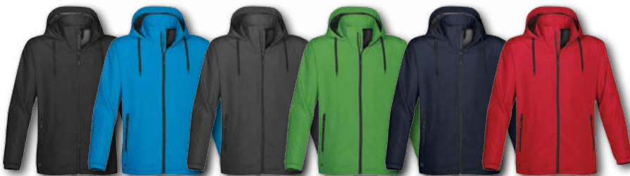
H & D: Black/Black