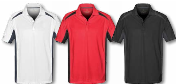
H & D: White/Navy