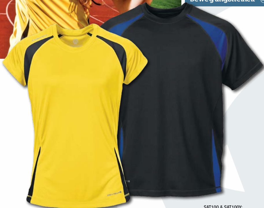
SAT100W: Sundance/ Tech Black