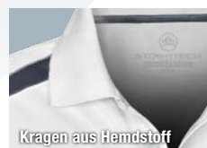
Kragen aus Hemdstoff