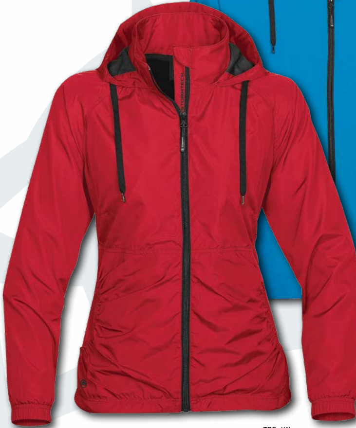
TRS-1: Electric Blue/Black